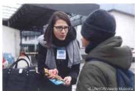
ウクライナの難民を助け、ポーランドにてUNHCR職員と対面する子ども